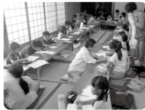
夏休み子ども教室