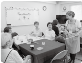
サロンでの楽しいひととき